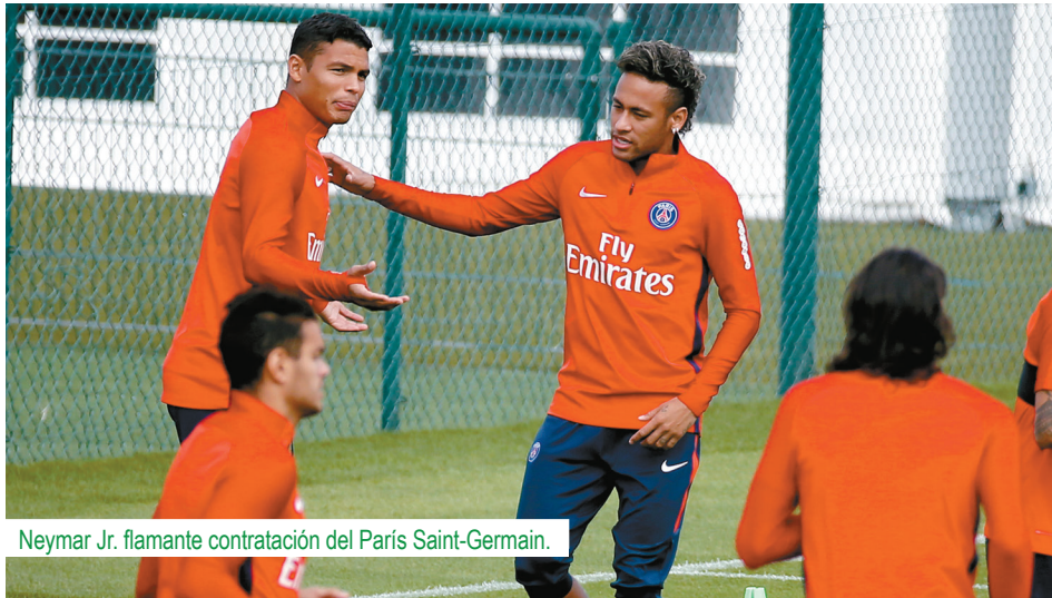
Neymar Jr. flamante contratación del París Saint-Germain.

Las principales estrellas de la selección de Brasil, incluidos Neymar, flamante jugador del PSG, el centrocampista Casemiro y los laterales Marcelo y Daniel Alves, fueron convocados por el seleccionador Adenor Leonardo Bachi 'Tite' para los partidos ante Colombia y Ecuador de las eliminatorias de Sudamérica a la Copa del Mundo Rusia-2018.